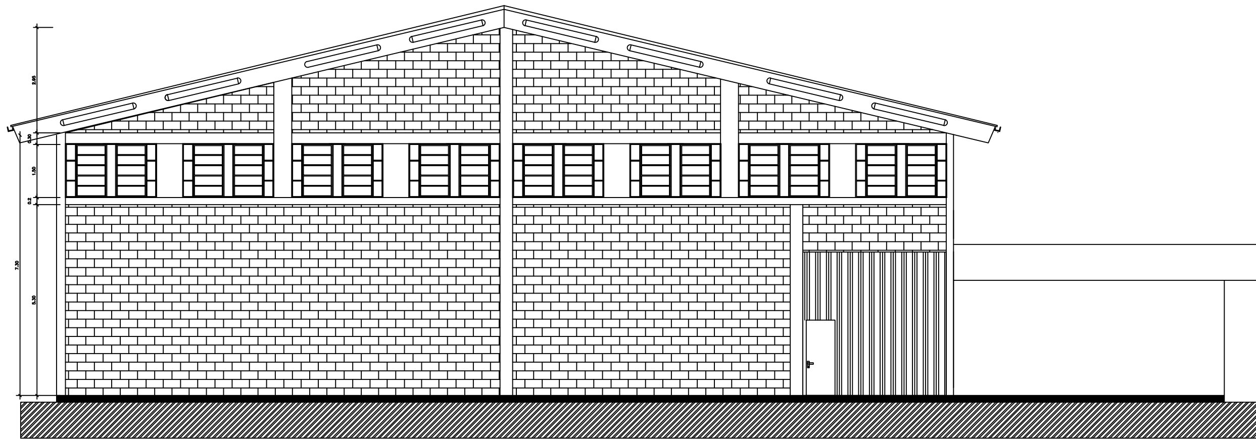
FACHADA FRONTAL FACHADA FUNDOS