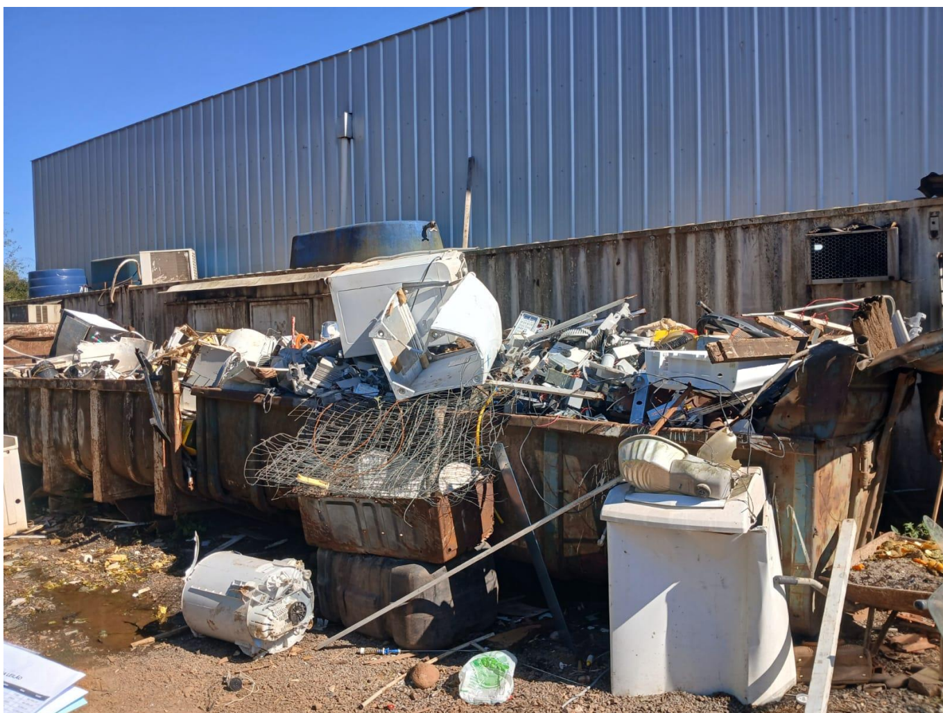
Arroio do Meio, 05 de setembro de 2025