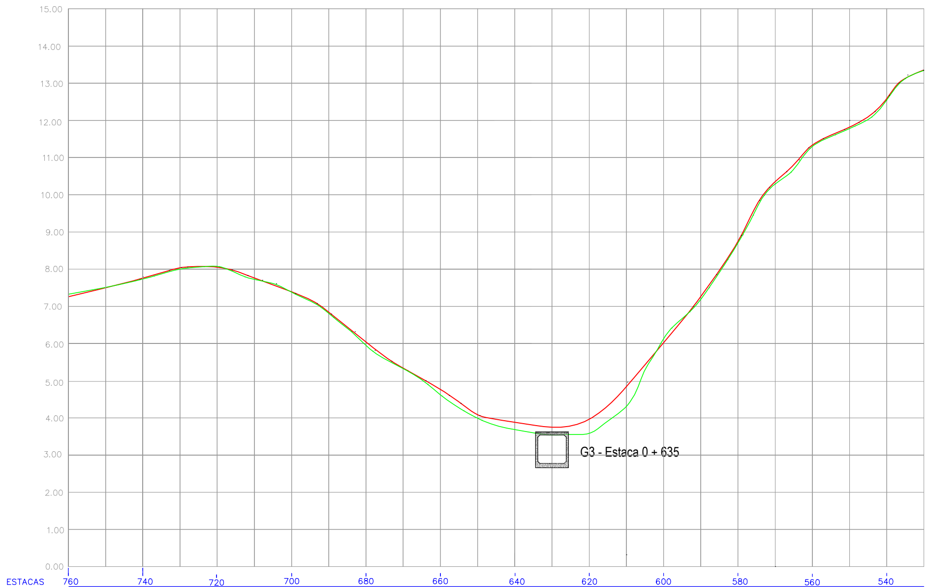
PERFIL LONGITUDINAL ESCALA HORIZ.: 1 / 1000 ESCALA VERT.: 1 / 100